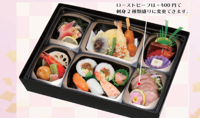
E-05 琴平 <38x28cm> 本体価格2,778円 3,000円