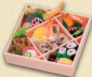
Y-22 あまのがわ <20x20cm> 本体価格1,112円 1,200円