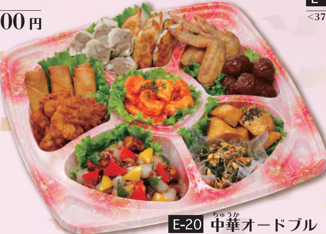
E-20 中華オードブル <40x40cm> 本体価格 3,704円 4,000円