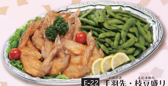
E-22 手羽先・枝豆盛り <38.5x27cm> 本体価格1,852円 2,000円