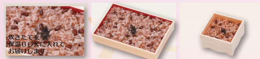
E-36 赤飯一升(保温) 本体価格3,704円 4,000円