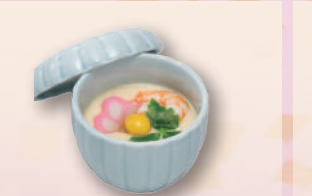
E-29 茶碗蒸し 本体価格325円 350円