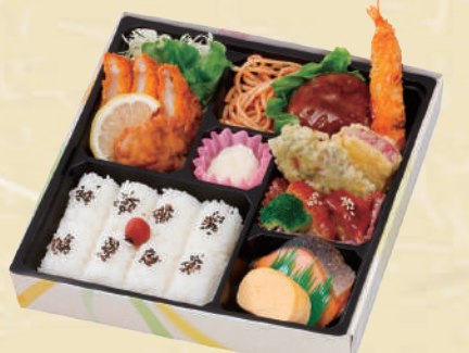
Y-3 デラックス弁当 <24.5x24.5cm> 本体価格926円 1,000円