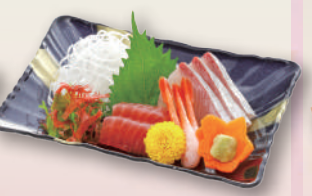
E-38 刺身3種盛り 本体価格741円 800円