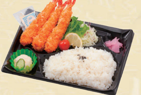
Y-12 トリプルエビフライ弁当 <27x19cm> 本体価格463円 500円