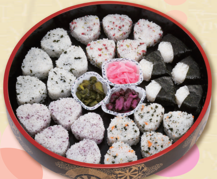
E-15 おにぎり桶 <43cmφ> 本体価格2,778円 3,000円

■紙パックお茶 本体価格 93円 100円 ■ペットボトルお茶 500ml 本体価格 150円 162円