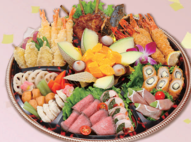
E-7 特選オードブル <48cmφ> 本体価格9,260円 10,000円