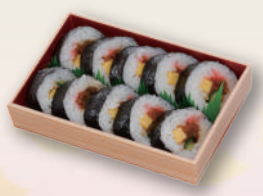
E-27 巻き寿司折り 本体価格463円 500円