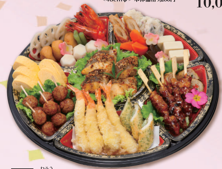
E-18 和風オードブル <41cmφ> 本体価格 3,704円 4,000円