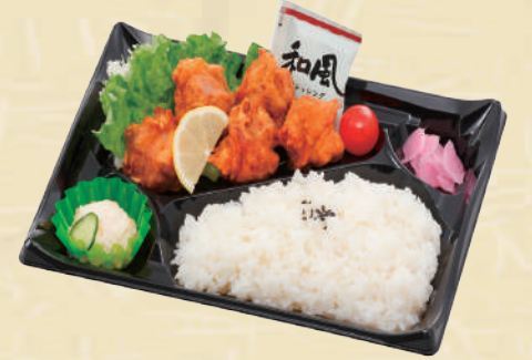
Y-13 もりもり唐揚げ弁当 <27x19cm> 本体価格463円 500円