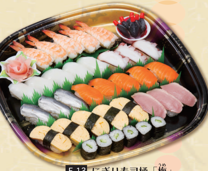
E-13 にぎり寿司桶「梅」 <36x36cm> 本体価格2,778円 3,000円