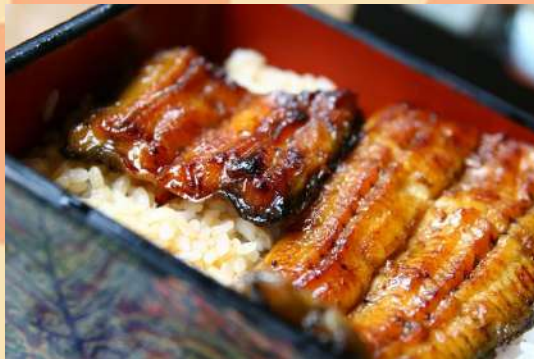
うな重 1/2尾 1,500円 (税込)