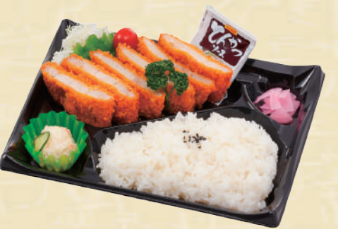
Y-15 必勝トンカツ弁当 <27x19cm> 本体価格463円 500円