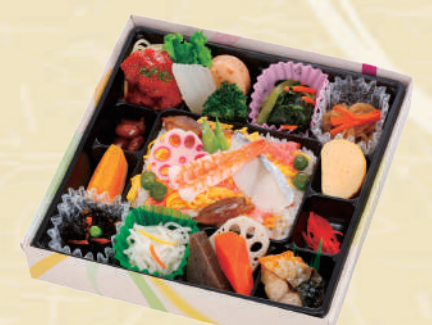
Y-19 さつき <24.5x24.5cm> 本体価格926円 1,000円