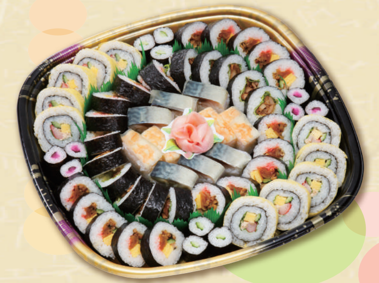
E-14 寿司盛り合わせ <39x39cm> 本体価格3,704円 4,000円