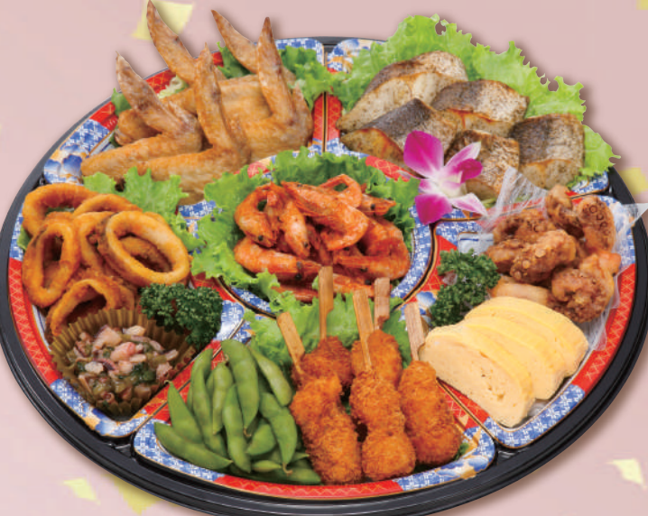
E-21 酒の肴オードブル <41cmφ> 本体価格3,704円 4,000円