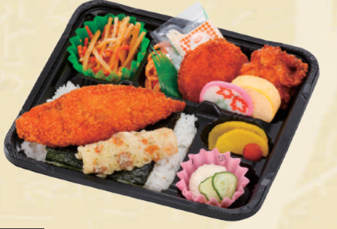
Y-17 のり弁当 <24x20cm> 本体価格463円 500円