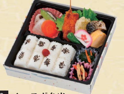
Y-9 くつろぎ弁当 <21.5x21.5cm> 本体価格556円 600円