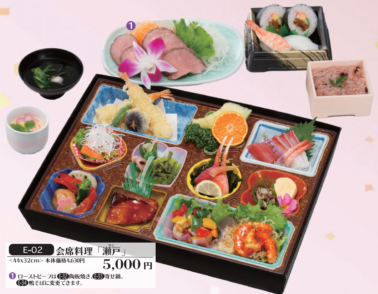
E-02 会席料理「瀬戸」 <44x32cm> 本体価格4,630円 5,000円 ① ローストビーフは(⑤2)陶板焼き、(⑤3)寄せ鍋、(⑤4)鴨そばに変更できます。