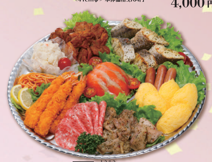
E-19 洋風オードブル <37cmφ> 本体価格 3,704円 4,000円