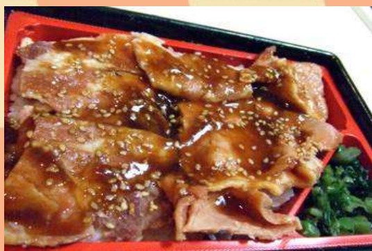
豚生姜焼き重 1,000円 (税込)