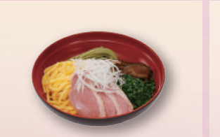
E-34 鴨そば 本体価格602円 650円