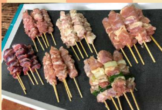
チルド焼鳥 30本セット 2,640円 (税込)