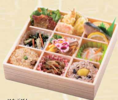
Y-1 華御膳 <20x20cm> 本体価格926円 1,000円