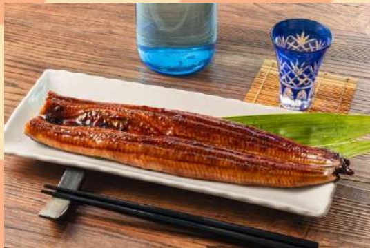
鰻蒲焼 1尾 2,500円 (税込)