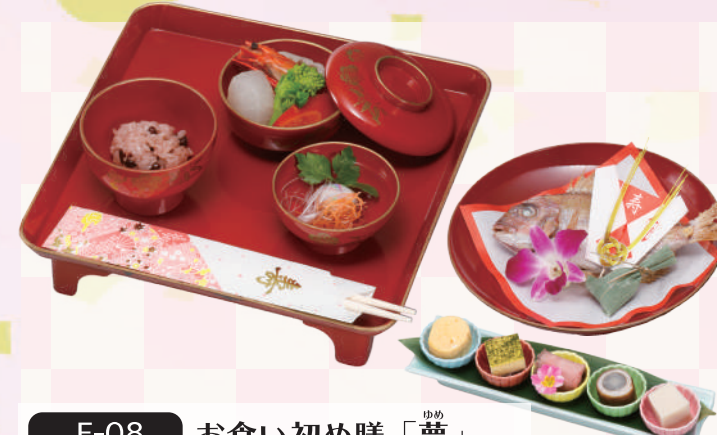
E-08 お食い初め膳「夢」 本体価格2,778円 3,000円