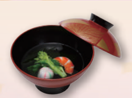
E-28 吸い物 本体価格278円 300円