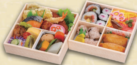
Y-21 2段折詰め「小桃」 <17.5x17.5cm> 本体価格1,482円 1,600円