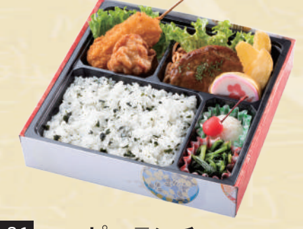
Y-31 ハッピーランチ <21.5x21.5cm> 本体価格556円 600円