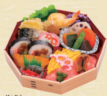
Y-20 八角弁当 <20.5x20.5cm> 本体価格741円 800円