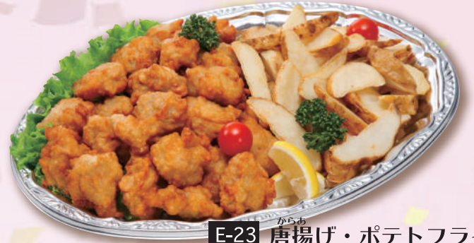
E-23 唐揚げ・ポテトフライ盛り <38.5x27cm> 本体価格1,852円 2,000円