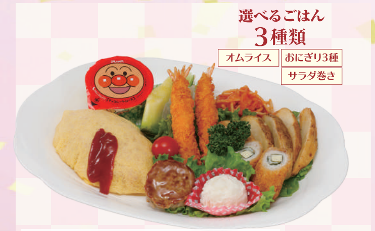
E-10 お子様ランチ <36x26cm> 本体価格1,852円 2,000円