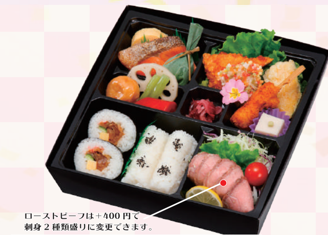
E-06 源平 <26x26cm> 本体価格1,852円 2,000円