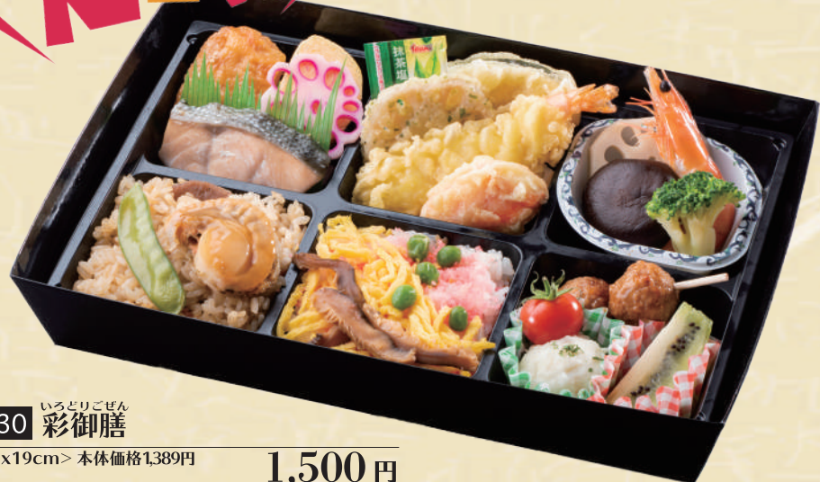
Y-30 彩御膳 <30x19cm> 本体価格1,389円 1,500円