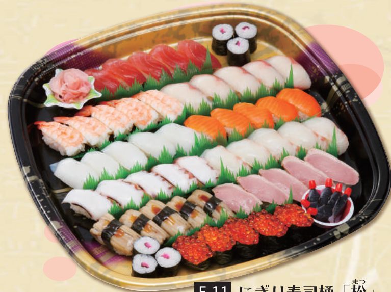
E-11 にぎり寿司桶「松」 <44x44cm> 本体価格6,482円 7,000円