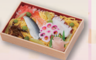
E-26 ちらし寿司 本体価格602円 650円