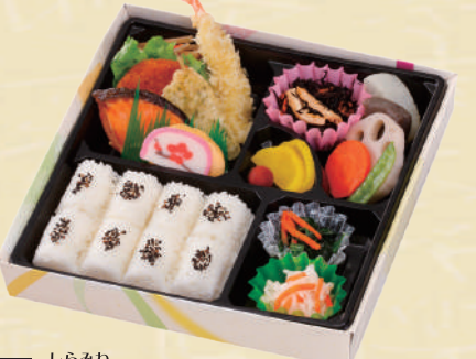
Y-5 白峰 <24.5x24.5cm> 本体価格741円 800円