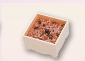
E-31 赤飯折り(小) 本体価格371円 400円