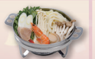
E-33 寄せ鍋 本体価格602円 650円