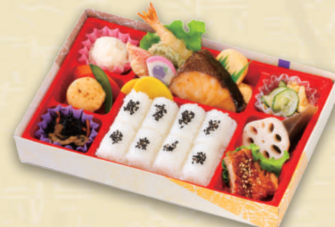
Y-2 夢咲弁当 <27.5x18.5cm> 本体価格926円 1,000円