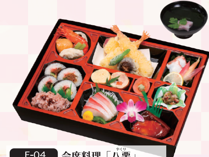
E-04 会席料理「八栗」 <38x28cm> 本体価格3,241円 3,500円