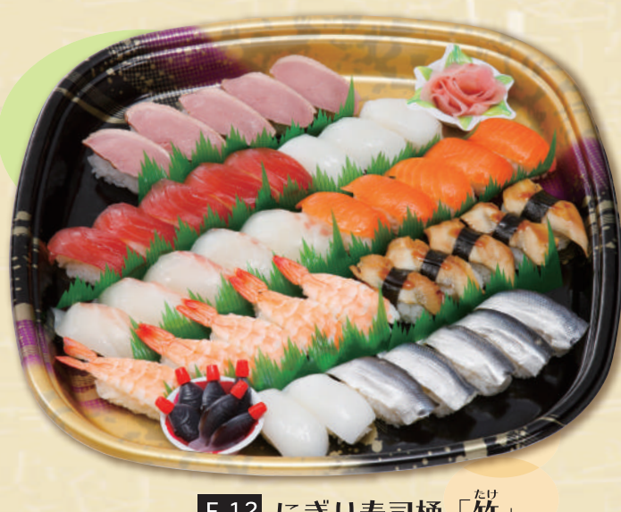
E-12 にぎり寿司桶「竹」 <39x39cm> 本体価格4,630円 5,000円