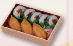
E-25 助六寿司折り 本体価格602円 650円