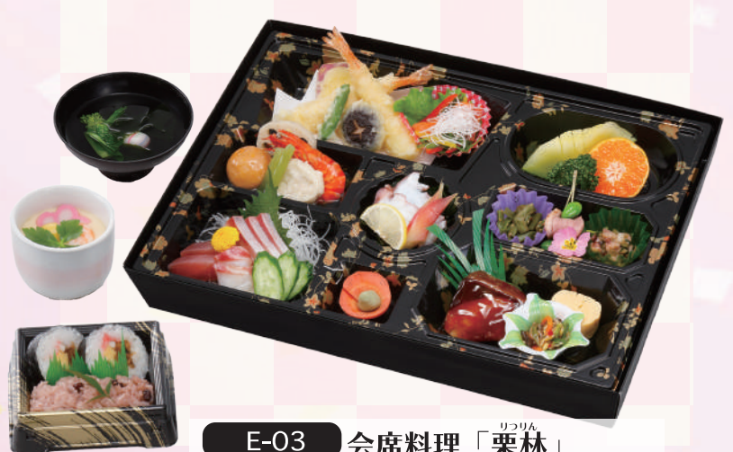
E-03 会席料理「栗林」 <44x32cm> 本体価格4,167円 4,500円