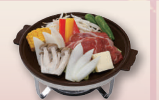
E-32 陶板焼き 本体価格602円 650円