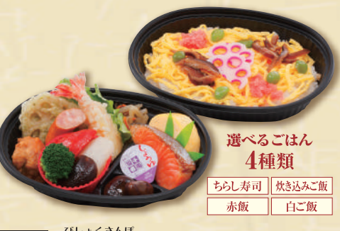
Y-7 美食散歩 <18.5x12cm> 本体価格741円 800円