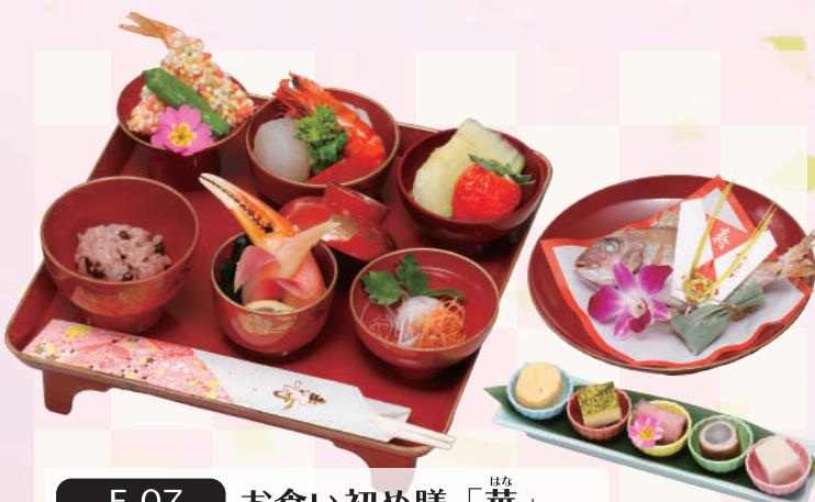
E-07 お食い初め膳「華」 本体価格4,167円 4,500円