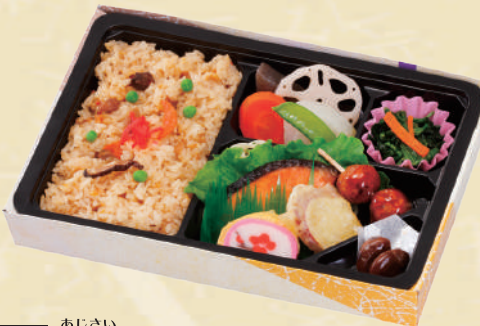
Y-6 味彩 <27.5x18cm> 本体価格741円 800円