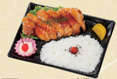
Y-11 ガッツリチキン南蛮 <27x19cm> 本体価格463円 500円