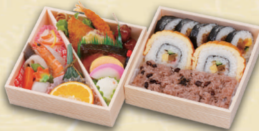
Y-16 2段折詰め「万葉」 <17.5x17.5cm> 本体価格2,037円 2,200円