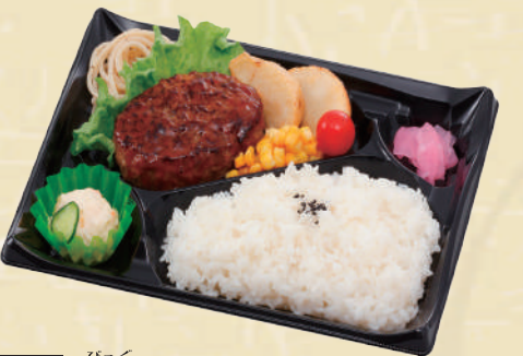
Y-14 BIGハンバーグ弁当 <27x19cm> 本体価格463円 500円