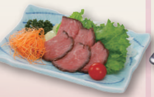
E-35 ローストビーフ 本体価格741円 800円