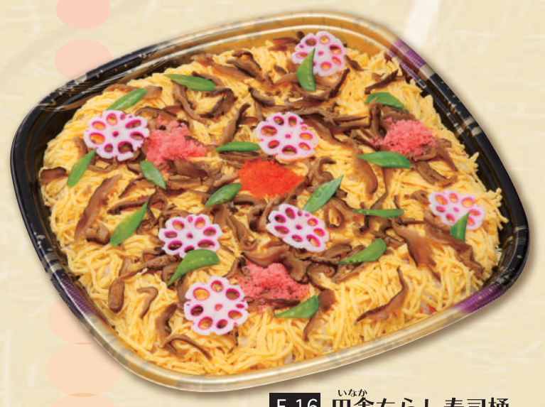
E-16 田舎ちらし寿司桶 <39x39cm> 本体価格3,704円 4,000円