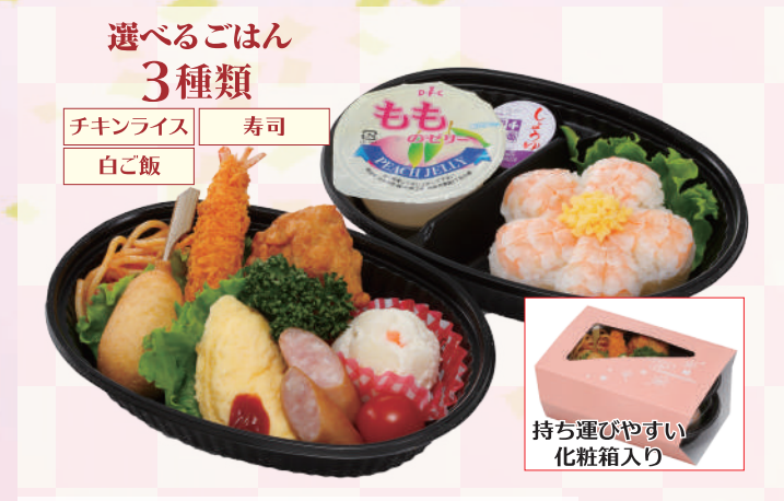
E-9 Kids ランチパック <18.5x12cm> 本体価格926円 1,000円