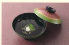
お吸い物 250円 (税別) (税込10% 275円) [税込 8% 270円]