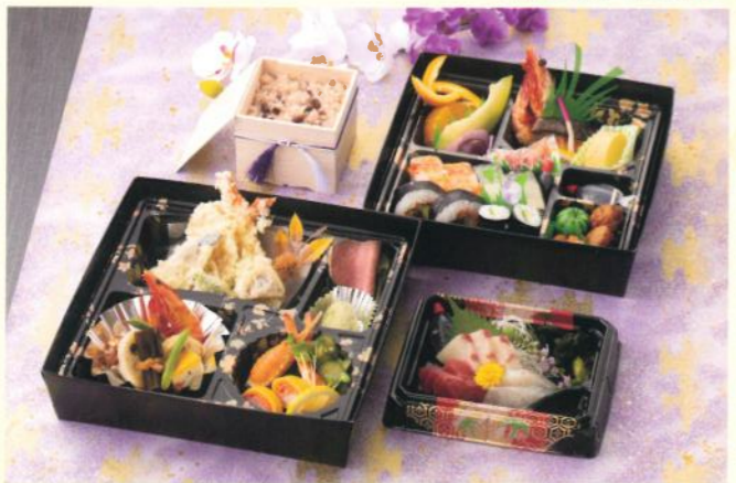
仏事・法要 会席パック 百合(ゆり) 6,000円 (税別) (税込10% 6,600円) (税込 8% 6,480円)