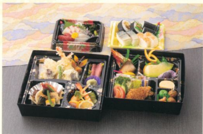
会席パック 飛雲(ひうん) 5,400円 (税別) (税込10% 5,940円) (税込 8% 5,832円)