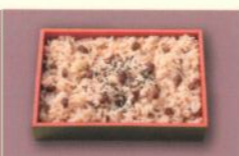
赤飯(1パック) 500円 (税別) (税込10% 550円) [税込 8% 540円]

お得な 2点セット 茶碗蒸し+お吸い物 500円 (税別) (税込10% 550円) [税込 8% 540円]