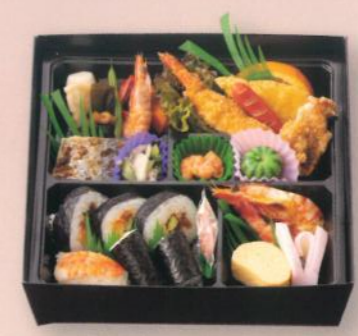
御弁当 撫子(なでしこ) 2,500円 (税別) (税込10% 2,750円) (税込 8% 2,700円)