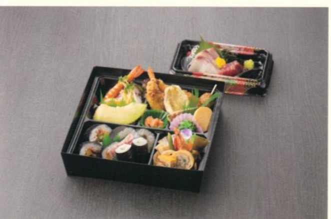
会席パック 皐月(さつき) 3,600円 (税別) (税込10% 3,960円) (税込 8% 3,888円)