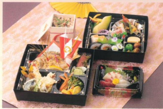
祝・会席パック 雅(みやび) 6,000円 (税別) (税込10% 6,600円) (税込 8% 6,480円)