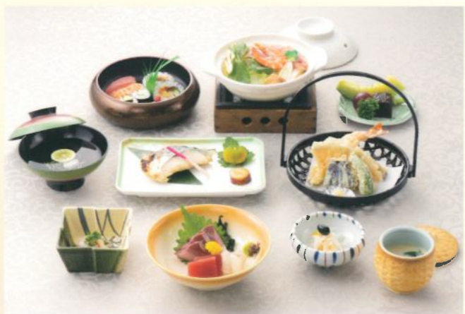
蓮華(れんげ) 5,000 (税別) 円(税込10% 5,500円)