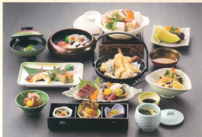
木蓮(もくれん) 6,000 (税別) 円(税込10% 6,600円)