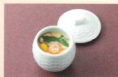
茶碗蒸し 430円 (税別) (税込10% 473円) [税込 8% 464円]