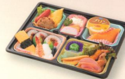
御弁当 (お子様用) 2,000円 (税別) (税込10% 2,200円) (税込 8% 2,160円)