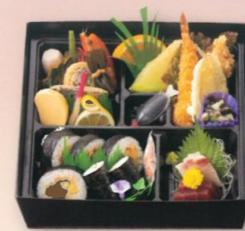
御弁当 椿(つばき) 【刺身付】 3,000円 (税別) (税込10% 3,300円) (税込 8% 3,240円)