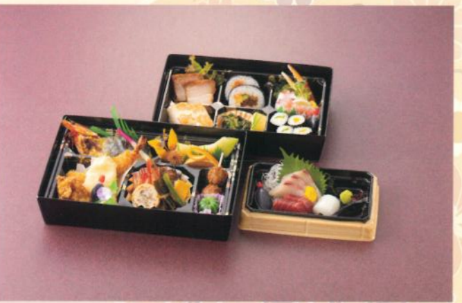
会席パック 嵯峨野(さかの) 4,300円 (税別) (税込10% 4,730円) (税込 8% 4,644円)