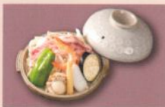
陶板焼き(4月~9月) 900円 (税別) (税込10% 990円) [税込 8% 972円]