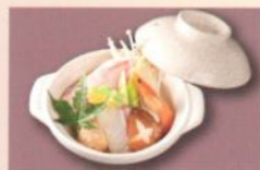
寄せ鍋(10月~3月) 900円 (税別) (税込10% 990円) [税込 8% 972円]