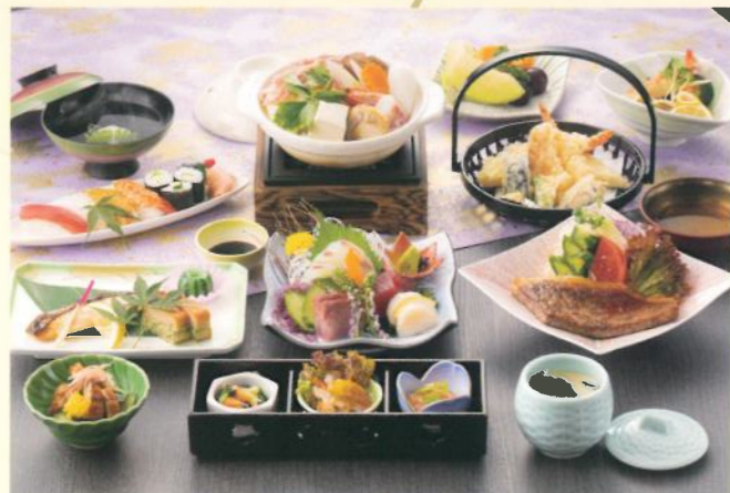
夕凧(ゆうなぎ) 8,000 (税別) 円(税込10% 8,800円)