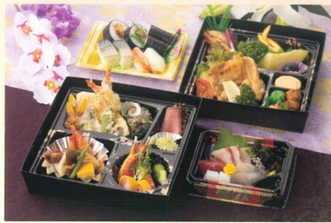
会席パック 暁(あかつき) 6,500円 (税別) (税込10% 7,150円) (税込 8% 7,020円)