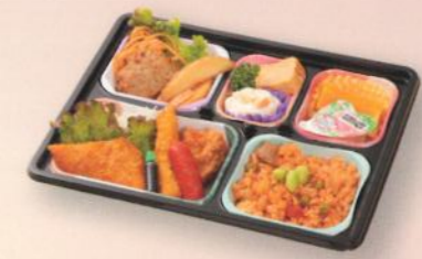
御弁当 (お子様用) 1,000円 (税別) (税込10% 1,100円) (税込 8% 1,080円)